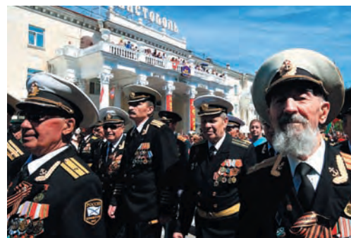
Россия, Севастополь. 9 мая 2016 г. Ветераны во время военного Парада.