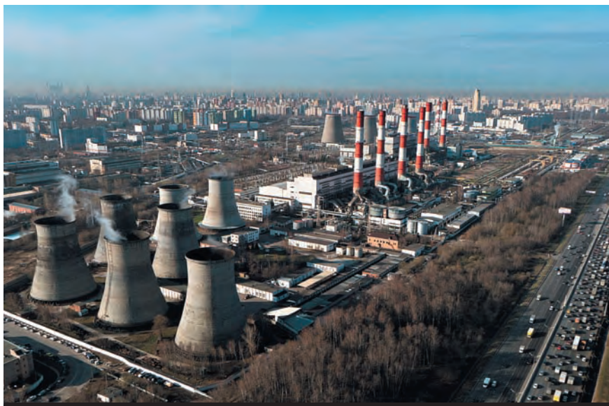
В России накоплен значительный научный и практический опыт в реализации экологических проектов.