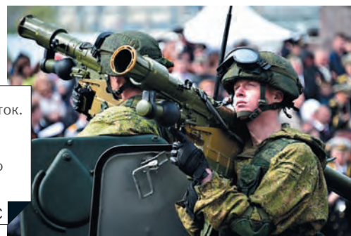
Россия, Владивосток. 9 мая 2016 г. Военнослужащий во время военного Парада.