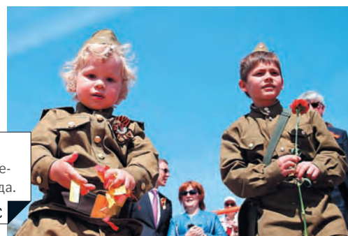
Россия, Казань. 9 мая 2016 г. Во время военного Парада.