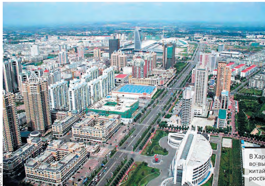
В Харбине создается постоянно действующая торгово-выставочная площадка, на которой представители китайской стороны могут ознакомиться с образцами российских товаров, предлагаемых на экспорт.

В Харбине под эгидой Российско-Китайского комитета дружбы, мира и развития создается постоянно действующая торгово-выставочная площадка, на которой представители китайской стороны могут ознакомиться с образцами российских товаров, предлагаемых на экспорт. Мероприятия такого рода помогают заинтересованным бизнесменам сократить время и усилия, необходимые для решения многих важных вопросов.