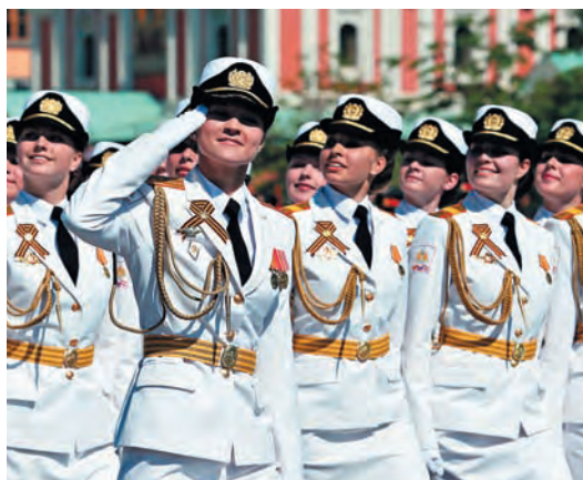
Россия, Москва. Сводный парадный расчет женщин-военнослужащих Военного университета Министерства обороны РФ на Красной площади во время военного Парада.