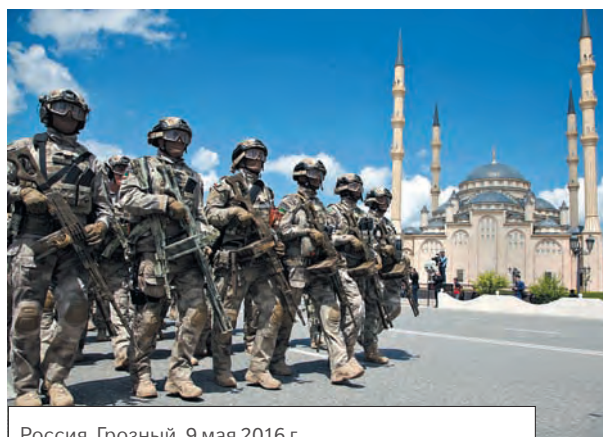
Россия, Грозный. 9 мая 2016 г. Во время военного Парада.