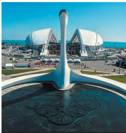
Стадион «Фишт» на территории Олимпийского парка, где будут проходить матчи чемпионата мира по футболу 2018 года.

Все большее значение сторонами придается эффективному информационному взаимодействию и обмену информацией между государственными органами и бизнес-сообществами обеих стран. Это касается не только обмена таможенной информацией и унификации стандартов (в узкоотраслевой сфере, в отношении разной продукции), но и налаживания постоянного прямого диалога в плане ежедневной координации действий, повседневной работы.