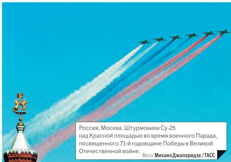
Россия, Москва. Штурмовики Су-26 над Красной площадью во время военного Парада, посвященного 71-й годовщине Победы в Великой Отечественной войне.