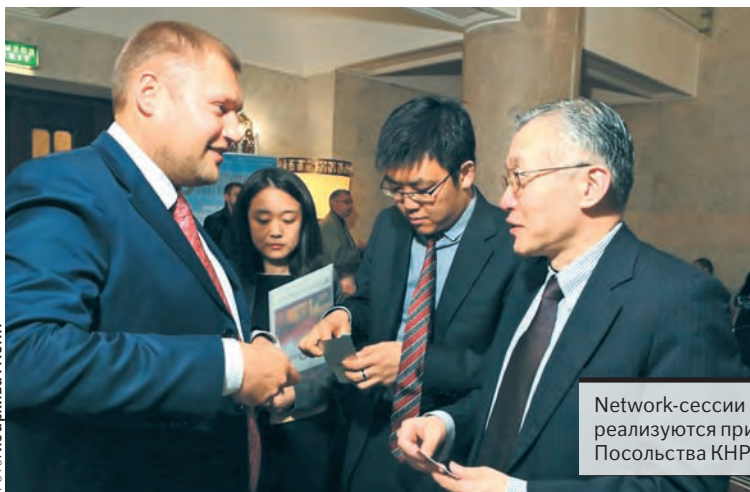
Network-сессии «Диалоги» реализуются при поддержке Посольства КНР в РФ.