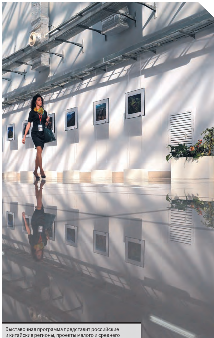
Выставочная программа представит российские и китайские регионы, проекты малого и среднего предпринимательства.

Форум-2016 с российской стороны организован Российско-Китайским комитетом дружбы, мира и развития, Российско-Китайским деловым советом, Федеральным агентством по делам молодежи, Союзом инновационно-технологических центров России, Центром координации поддержки экспорта Краснодарского