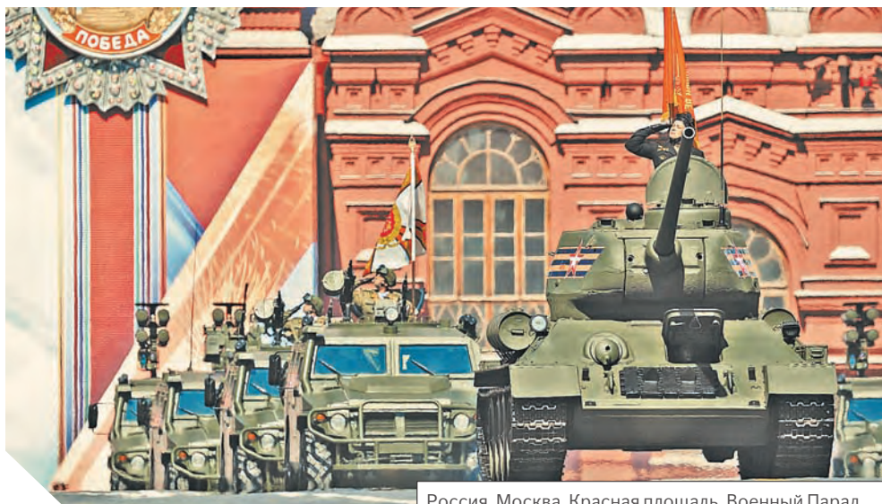
Россия, Москва, Красная площадь. Военный Парад, посвященный 71-й годовщине Победы в Великой Отечественной войне.