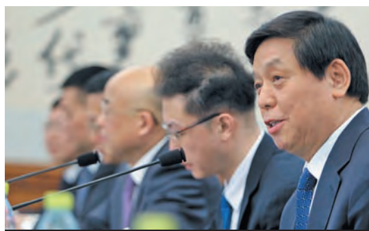
Руководитель канцелярии ЦК Коммунистической Партии КНР Ли Чжаньшу (справа) высоко оценил результаты совместной работы.

то есть и с крупными взяточниками, и с мелкими, — пояснил Сергей Иванов. — Нам есть чему поучиться, в том числе в плане законодательства. Но не меньший интерес Китай проявляет к нашему опыту, в частности, как мы рассматриваем конфликт интересов, как мы подходим к профилактике коррупционных преступлений и правонарушений. И самое главное — хотел бы это подчеркнуть — мы договорились, что будем еще более плотно взаимодействовать на международной арене, в том смысле, что западное понятие коррупции зачастую открыто и, я бы сказал, нагло используется в политических целях, не имеющих ничего общего с борьбой с преступностью как таковой. И здесь наши подходы полностью и целиком совпадают. Скорее всего, многие из обсуждавшихся тем найдут свое отражение в ходе предстоящего визита Владимира Путина в Китай. По словам Сергея Иванова, основная цель проведенных им переговоров — сделать так, чтобы «этот визит, как и все предыдущие за последние годы, принес конкретную, осязаемую для наших народов пользу». ★