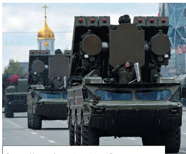
Россия, Новосибирск. 9 мая 2016 г. Реактивные системы залпового огня (РСЗО) «Град» на площади имени Ленина во время военного Парада.