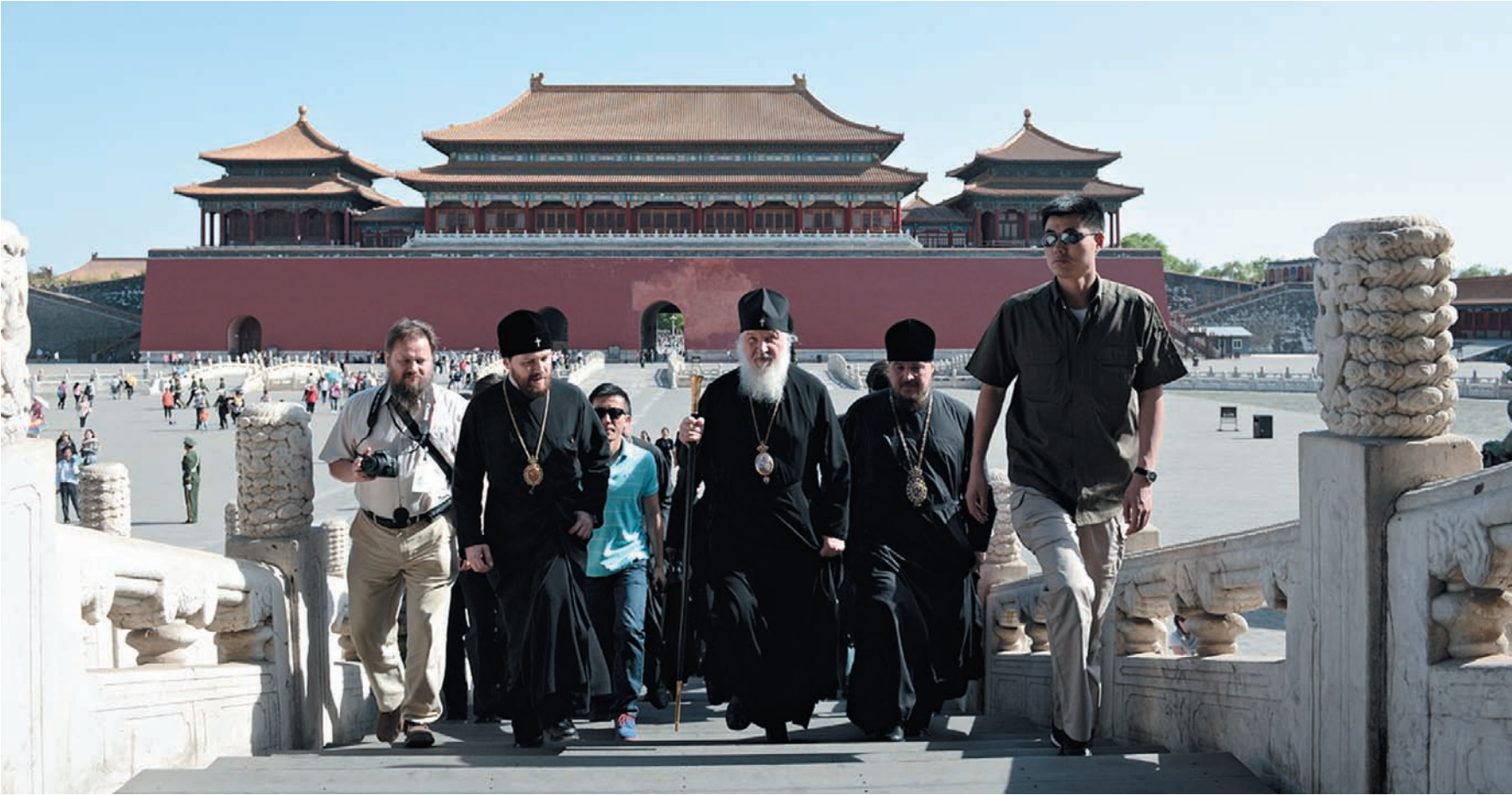
СВЯТЕЙШИЙ ПАТРИАРХ КИРИЛЛ В ГУГУНЕ (ПЕКИН).

Глава Русской православной церкви затронул также тему деятельности китайской православной церкви, которая существует более 300 лет. Патриарх Кирилл сказал: «Очень надеюсь, что те вопросы, которые стоят на повестке дня, будут постепенно решаться при полном уважении Конституции и законодательства Китая». Его Святейшество не уточнил, о каких именно вопросах идет речь, однако представители делегации РПЦ сообщили, что прежде всего имеются в виду улучшение религиозного климата для православных христиан в КНР и возобновление богослужений в некоторых православных церквях.