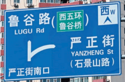
НА МНОГИХ ДОРОЖНЫХ УКАЗАТЕЛЯХ ЕСТЬ ЗНАКИ, УКАЗЫВАЮЩИЕ НА СТОРОНЫ СВЕТА.

Ориентироваться в городской среде Пекина принято не так, как в наших городах. Вместо того чтобы занимать голову постоянным инвертированием понятий «направо — налево», пекинцы с давних времен приноровились полагаться на стороны света. Спросив у местного жителя дорогу, вы, скорее всего, получите ответ вроде: