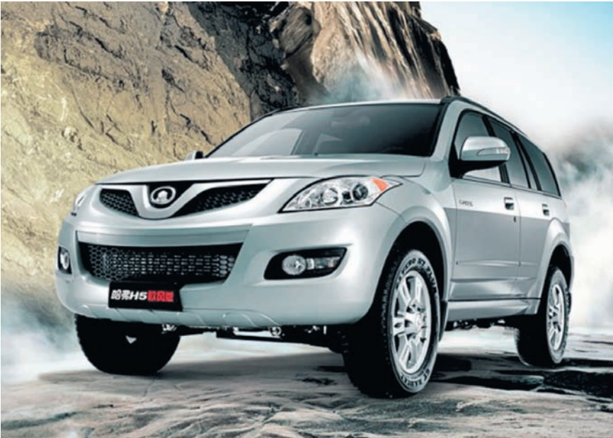
ИЗ НОВИНОК GREAT WALL ОСОБЕННО ВЫДЕЛЯЕТСЯ ОБНОВЛЕННЫЙ HVER H5. ВПЕЧАТЛЯЕТ ЕГО УРОВЕНЬ ЗАЩИТЫ — 7 ПОДУШЕК БЕЗОПАСНОСТИ, ESP И ABS ПОСЛЕДНЕГО ПОКОЛЕНИЯ.

Отметим главное — китайский автопром сейчас переживает интересный период самоутверждения. Пройдя в своем развитии этап заимствований и креативного копирования заморских авто, китайцы решились на самостоятельные ходы. Появилась интересная тенденция показывать себя смелым и слегка шокирующим модельером. Кто знает, может, в этом и состоит смысл развития китайского, да и мирового автопрома.