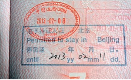
БЕЗВИЗОВОЕ ПРЕБЫВАНИЕ В СТОЛИЦЕ КИТАЯ ОФОРМЛЕНО.

С 1 января 2013 года россияне, как и другие граждане 45 стран, следующие транзитом через Пекин, могут оставаться в китайской столице без визы в течение трех суток. Оформить безвизовое пребывание можно в столичном аэропорту Шоуду. На железнодорожных вокзалах Пекина эта услуга пока недоступна.