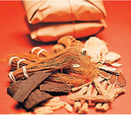
КИТАЙСКИЕ ВРАЧИ СОВЕДУЮТ ЛЕЧИТЬСЯ ОТ ГРИППА НЕ ТОЛЬКО КОРНЯМИ ВАЙДЫ, НО ТАКЖЕ ШЛЕМНИКОМ, ЖИМОЛОСТЬЮ И ДРУГИМИ ПРЕПАРАТАМИ ТРАДИЦИОННОЙ МЕДИЦИНЫ.

А вот одно наблюдение из жизни. Традиционный китайский медик, выходя на улицу в ветреный день (даже если стоит теплая погода), обязательно обмотает шею шарфом или, по крайней мере, наденет пальто с высоким воротником. Китайские врачи одеваются так, поскольку каждый день им приходится лечить людей, заболевших из-за проникновения в организм холодного воздуха. Врачи называют его «внешним злокачественным фактором». В древнем Китае холодный ветер воспринимали как некоего демона, а акупунктура была для китайцев чем-то вроде копий и стрел, при помощи которых с этим демоном боролись. Эти древние образы, по сути, были не далеки от истины. Достаточно рассмотреть под микроскопом странные, причудливые и нередко чудовищные формы вирусов или бактерий с торчащими шипами.