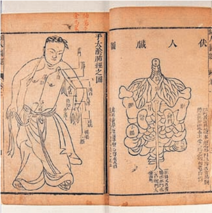
ВЕЧНЫЕ УЧЕБНИКИ ДЛЯ КИТАЙСКИХ ЦЕЛИТЕЛЕЙ.