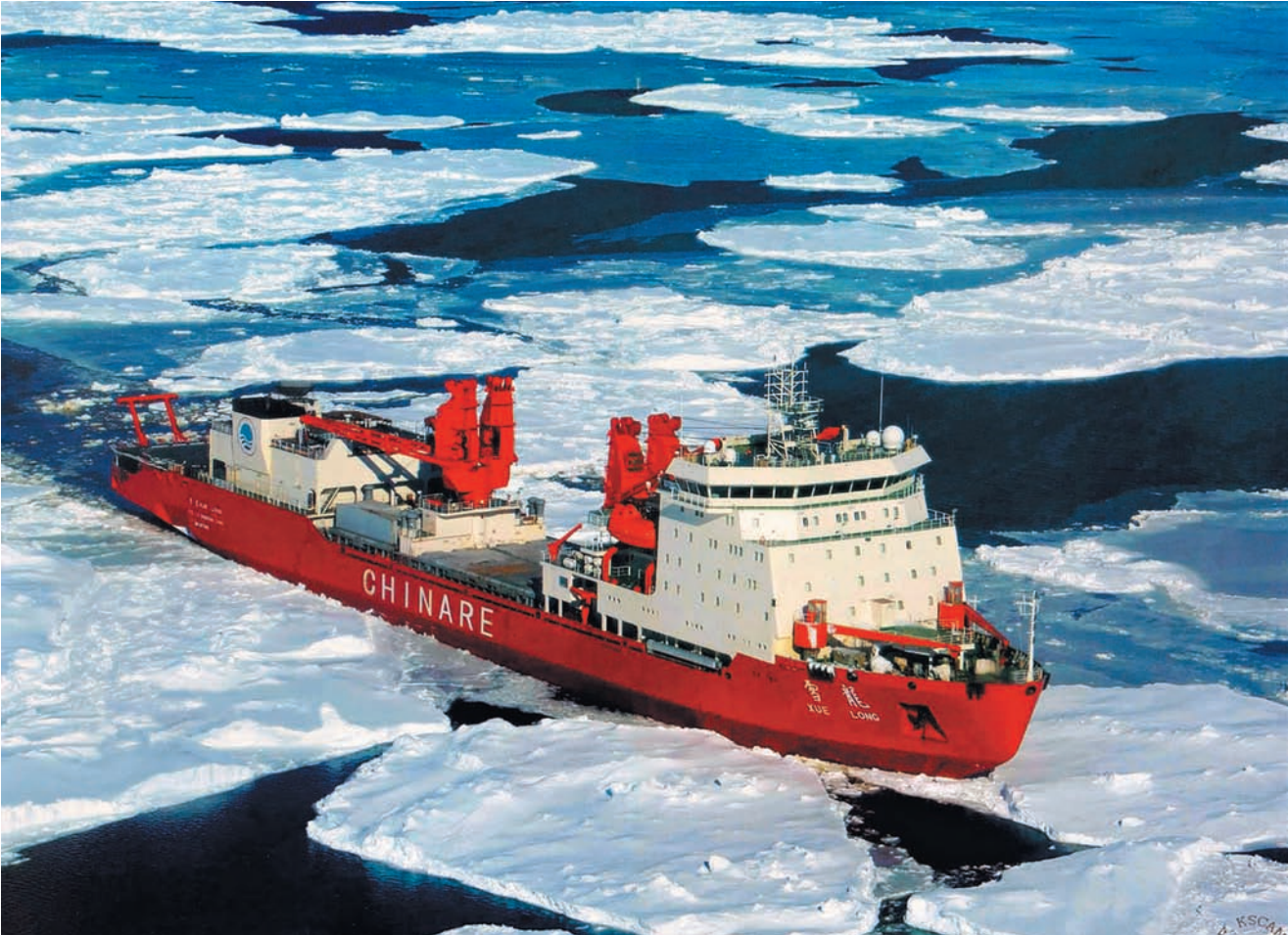
Китай запланировал начало коммерческого использования Северного морского пути уже летом этого года.

В этом году Россия планирует начать развертывание многоцелевой космической системы наблюдения «Арктика». Среди основных задач системы — обеспечение воздушного сообщения по кроссполярным маршрутам, а также сопровождение морского транспорта по Северному морскому пути.