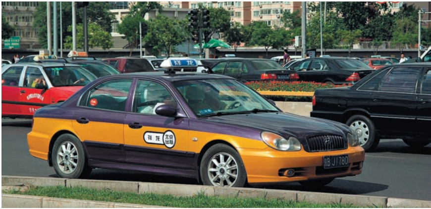
ТАКСИ В ПЕКИНЕ МОЖНО ОПРЕДЕЛИТЬ ПО ЖЕЛТО-СИНЕЙ, ЖЕЛТО-ЗЕЛЕННОЙ ИЛИ ЧЕРНОЙ ОКРАСКЕ АВТО.

бы говорит само за себя. Затем определите «золотую середину» и направляйтесь в нормальный, средней дороговизны (от 8 до 35 юаней за блюдо) китайский ресторан. Гораздо важнее микробиологического — этнопсихологический фактор. Истории о том, как «в первый же день нас просто обобрали» основаны на нежелании терять лицо. Запомните! Никто не заставляет вас тратить больше, чем вы захотите. В Китае, как нигде, наверное, клиенты невероятно требовательны ко всему, что касается еды, и к ценам тоже. Поэтому не торопитесь. Изучите меню. Не бойтесь «причинить неудобства». Напротив, своей тщательностью вы заработаете невольное уважение. А теперь — внимание! Если вы поняли, что предполагаемый заказ вам не по карману, просто встаньте и уйдите, поблагодарив официанта. Ничего зазорного в этом нет. За теплую воду с лимоном, которую официант принесет вам в 99 ресторанах из 100, платить не надо.