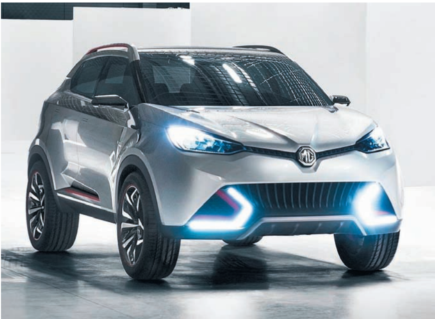
СЕРИЙНЫЙ КРОССОВЕР MG CS РАДУЕТ «МУСКУЛИСТЫМИ» ФОРМАМИ И НЕМНОГО «СЕРДИТЫМ» ЭКСТЕРЬЕРОМ.

На автосалоне в Шанхае SAIC, в данном случае в лице китайско-британского производителя, представил концепт-кроссовера MG CS. Новинку на базе прототипа планируют продавать не только на