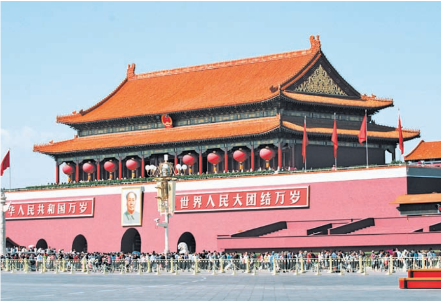
ОСМОТР ДОСТОПРИМЕЧАТЕЛЬНОСТЕЙ ПЕКИНА ПРАВИЛЬНЕЙ ВСЕГО НАЧАТЬ С ПЛОЩАДИ ТЯНЬАНЬМЭНЬ.

Буквально через пару остановок метро от Гомао находится барная улица Санлитунь, где не только по выходным, но и в будние дни собираются повеселиться пекинская золотая молодежь и постоянно живущие в столице иностранцы. Здесь же расположено множество известных торговых центров. Россияне любят заниматься шопингом на рынке Ясю, который, в отличие от знаменитого «Шелкового рынка», не избалован вниманием туристов, поэтому продавцы там не сильно задирают цены и всегда готовы поторговаться.