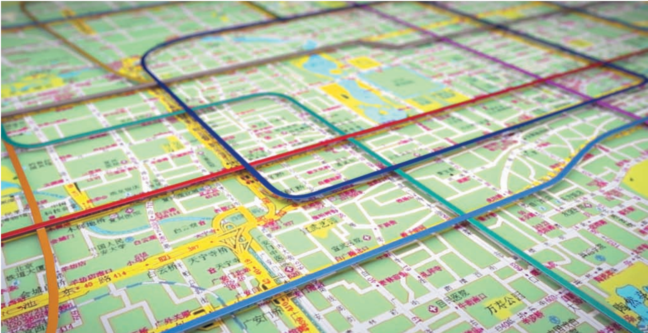
ОРИЕНТИРОВАТЬСЯ В ПЕКИНЕ ПРИНЯТО ПО СТОРОНАМ СВЕТА.

пройдите столько-то кварталов (метров, километров) на запад, а затем поверните на юг. С непривычки это обескураживает. Однако привычка вырабатывается довольно быстро. Главное — заблаговременно понять, где именно восходит и заходит солнце, где находитесь вы или ваш отель. Кстати, на многих дорожных указателях и входах в метро есть знаки, указывающие на стороны света.