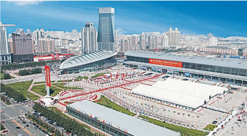
ХАРБИНСКАЯ ТОРГОВО-ЭКОНОМИЧЕСКАЯ ЯРМАРКА ЯВЛЯЕТСЯ ОДНОЙ ИЗ КРУПНЕЙШИХ В КИТАЕ.

В этой связи наиболее любопытен проект Забайкальского края «Русская деревня», также представленный на экспозиции в рамках кластера «Озеро Байкал». Проект предполагает создание туристско-рекреационного комплекса в приграничном российском поселке Забайкальск, который находится на расстоянии не более 10 км от города Маньчжурия. Его основной замысел — воссоздание русского поселения с национальным колоритом и элементами современности.