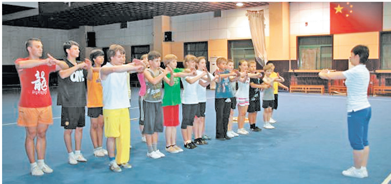
ИНОСТРАНЦЫ ПРИЕЗЖАЮТ В КИТАЙ ОБУЧАТЬСЯ СПОРТИВНОМУ УШУ.

Несмотря на то, что в Китае плата за занятия как спортивным, так и традиционным ушу далеко не символическая, любители этого единоборства продолжают обивать пороги китайских мастеров и школ. Ведь это лучшая возможность не только обрести новые знания, но и попутешествовать.