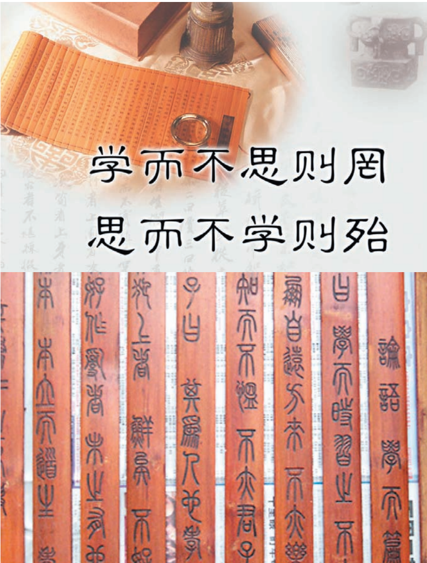
«ЛУНЬ ЮЙ» («БЕСЕДЫ И РАССУЖДЕНИЯ»).