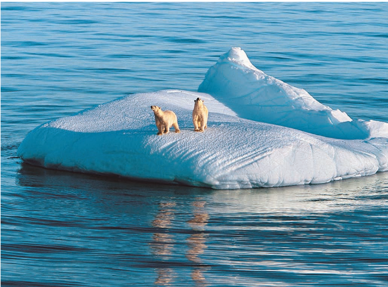
В последние несколько лет площадь полярных льдов стала на треть меньше, чем десять лет назад.

А пока Китай стремится укрепить свои позиции в разных международных организациях, и прежде всего в Арктическом совете, где наряду с Италией и Южной Кореей имеет статус временного наблюдателя. В декабре 2012 года Китай направил в этот международный орган обновленную заявку на повышение статуса до уровня страны-наблюдателя, подчеркнув, что ему небезразлична судьба Арктики. Новый статус даст определенные политические обоснования и правовую основу для практического освоения региона. В мае этого года Арктический совет на своем саммите министров иностранных дел положительно решал вопрос о статусе Китая. Значение членства в Арктическом совете, все более превращающемся в важнейшую арену для международных действий в регионе, рас-