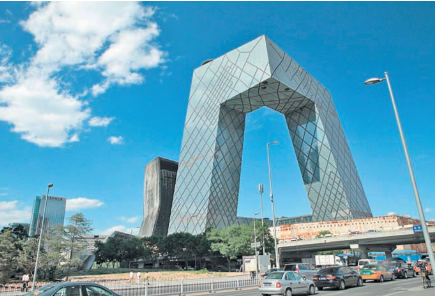
В РАЙОНЕ ГОМАО, ДЕЛОВОМ ЦЕНТРЕ КИТАЙСКОЙ СТОЛИЦЫ, СОСРЕДОТОЧЕНЫ САМЫЕ УЗНАВАЕМЫЕ ОБРАЗЧИКИ СОВРЕМЕННОЙ ПЕКИНСКОЙ АРХИТЕКТУРЫ.