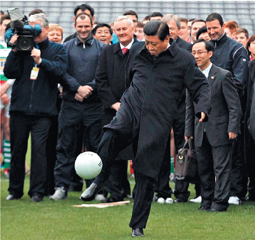
СИ ЦЗИНЬПИН НЕРАВНОДУШЕН К СПОРТУ. СТАРАЕТСЯ НЕ ПРОПУСКАТЬ СОРЕВНОВАНИЯ ПО БАСКЕТБОЛУ, ФУТБОЛУ И БОКСУ.

Растущая потребность в инфраструктуре на Российском Дальнем Востоке предлагает отличные возможности для выполнения задач меморандума по содействию экономическому развитию и достижению высокой доходности для наших инвесторов при управляемом уровне рисков, — сказал после подписания соглашения генеральный содиректор Российско-китайского инвестиционного фонда (РКИФ) Ху Бин.