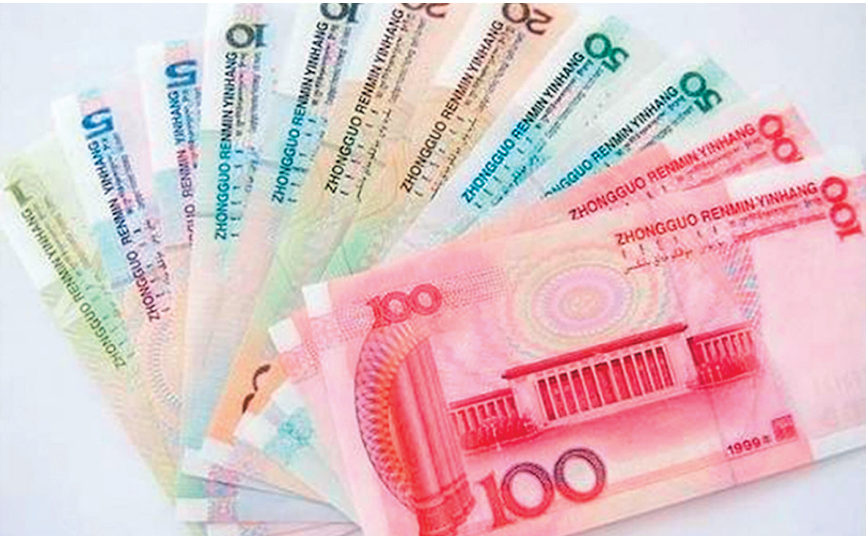
ЮАНЕВАЯ КОРЗИНА ПРИСУТСТВУЕТ В ЗОЛОТОВАЛЮТНЫХ ЗАПАСАХ БОЛЬШИНСТВА АЗИАТСКИХ ГОСУДАРСТВ, БРАЗИЛИИ, АВСТРИИ, ВЕНЕСУЭЛЫ. И В ЭТОМ ГОДУ СПИСОК ДОЛЖЕН РАСШИРИТЬСЯ.

Учитывая сложившуюся ситуацию, россиянам сейчас хранить сбережения в юанях имеет смысл только в случае, если это долгосрочный вклад, который не придется использовать в ближайшее время. Эксперты полагают, что надолго законсервированная юаневая копилка себя, несомненно, оправдает, учитывая медленную, но верную глобальную экспансию китайской валюты, а также стабильный рост экономики КНР.