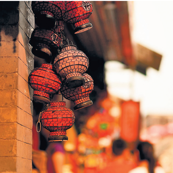
ЗДЕСЬ МОЖНО БЫЛО КУПИТЬ НЕ ТОЛЬКО ТОВАРЫ СО ВСЕХ КОНЦОВ ОБШИРНОЙ СРЕДИННОЙ ИМПЕРИИ, НО И ЗАМОРСКИЕ ДИКОВИНКИ.

Одним из особых импортных товаров стал табак. Табакокурение проникло в Китай как раз в этот период (XVIII в.). Вначале мода захватила верхи, и поэтому удовольствие стоило дорого. Заграничный табак логично было продавать там, где покупатели могли себе это позволить. Торговцы, быстро поняв, что новое увлечение высшего общества может принести большой барыш, стали одну за другой открывать лавки, и вскоре на Хоухае возникла целая табачная улица.