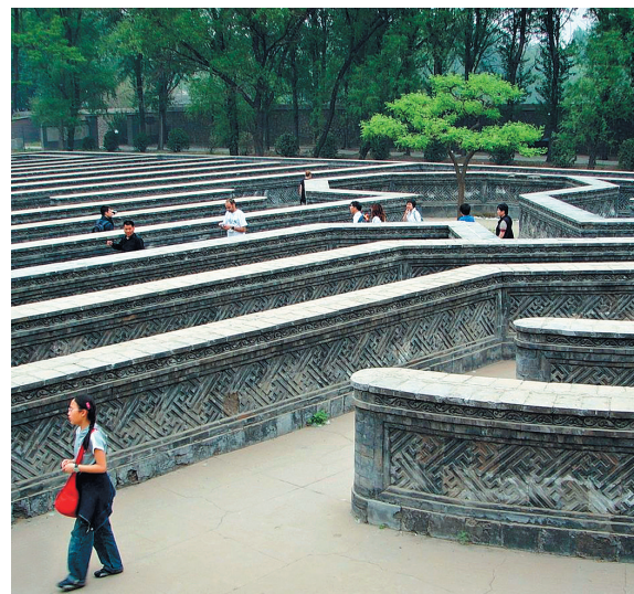
ВОССТАНОВЛЕН ЛАБИРИНТ ВАНЬХУАЧЖЭНЬ («ВЕРЕНИЦА 10 ТЫСЯЧ ЦВЕТОВ»). ПО НЕМУ НАЛОЖНИЦЫ ПРОХОДИЛИ В ПОКОЙ ИМПЕРАТОРА.