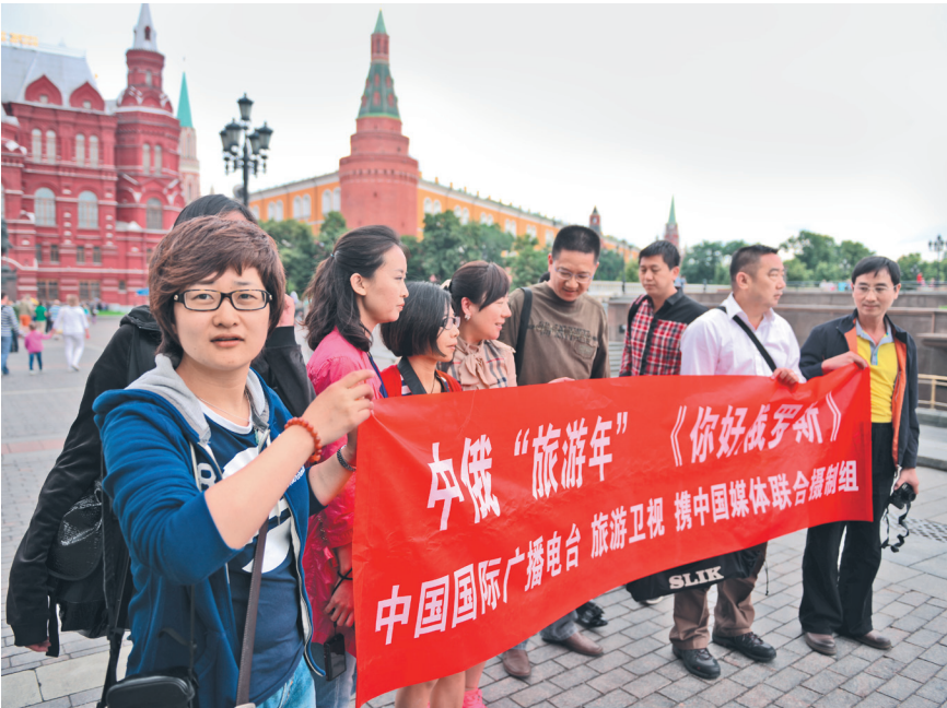
КРУПНЕЙШЕЙ МЕДИА-АКЦИЕЙ В РАМКАХ ГОДА РОССИЙСКОГО ТУРИЗМА СТАЛ ПРОЕКТ «ЗДРАВСТВУЙ, РОССИЯ». ОПЕРАТОРОМ ПРОЕКТА ВЫСТУПИЛО МРК.

Логическим продолжением этой медиаакции станет второй сезон проекта «Здравствуй, Китай!». Напомним, первый сезон был представлен российской аудитории в 2009 году в рамках обмена языковыми годами между РФ и КНР. Россиянам показали 100 видеосюжетов, посвященных культуре и традициям Поднебесной. Их увидели порядка 50 млн человек, то есть каждый четвертый житель России. В рамках второго сезона будет подготовлено по 100 видеороликов, радиопередач и публикаций о туристических возможностях Китая. Этот проект МРК осуществляет совместно с «Голосом России», телеканалом ВГТРК «Моя планета», «Российской газетой» и ИТАР—ТАСС. Видеоролики цикла «Здравствуй, Китай!» будут показывать по телеканалу «Моя планета» с июня по ноябрь 2013 года. Руководители России и Китая уверены, что эта медиакампания заполнит для россиян множество «белых пятен» на туристической карте Китая.