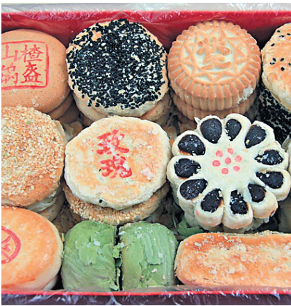
ДАВНЯЯ ТРАДИЦИЯ В КИТАЕ ДАРИТЬ ВЫПЕЧКУ К ПРАЗДНИКАМ.

количестве — по четыре, шесть или восемь штук. К примеру, если вы дарите вино, то должно быть две или четыре бутылки вместе. При покупке фруктов для подарка, таких как яблоки, апельсины, независимо от веса важно их количество. Как правило, дарят четыре (四季平安 sì jì píng'ān — четыре времени года — мир и покой), шесть (六六大顺 liù liù dà shùn — двойная шестерка к большой удаче), восемь (四平八稳 sì píng bā wěn — стабильность) или десять (十全十美 shí quán shí měi — верх совершенства) штук. Следует помнить, что фрукты не дарят малознакомым людям.