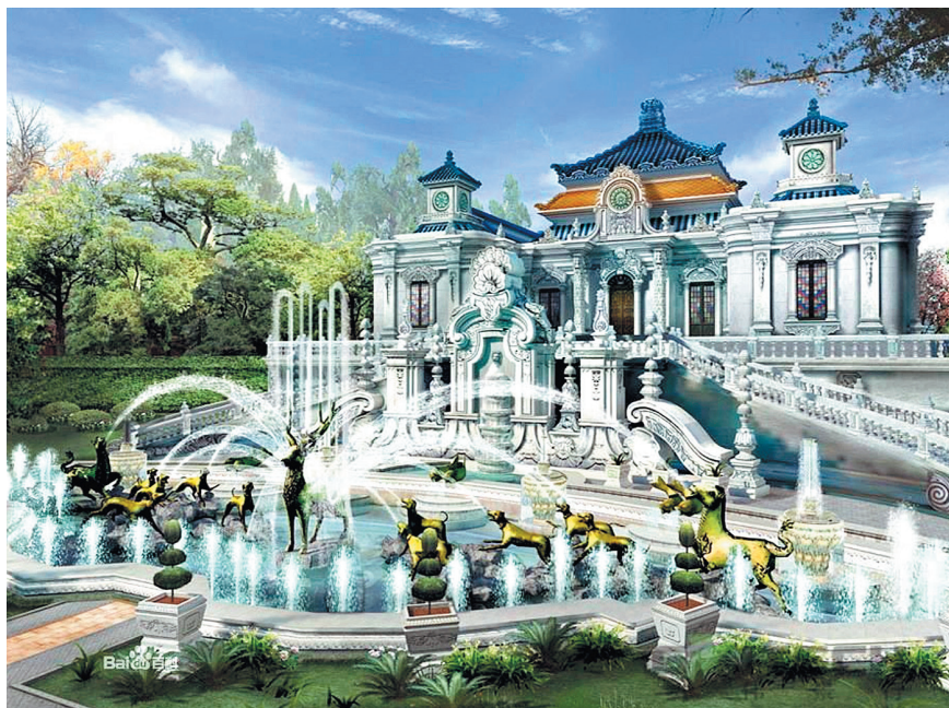
ВОТ ТАК КОГДА-ТО В ПОЛДЕНЬ ВЫГЛЯДЕЛИ ДВОРЕЦ «ОЧАРОВАНИЕ НЕОБЫЧАЙНОЙ ГАРМОНИИ» И ФОНТАН С БРОНЗОВЫМ ЗОДИАКОМ.

Сейчас главное — вернуть разграбленное национальное достояние, которое насчитывает многие тысячи артефактов. Китайское правительство жестко реагирует на деятельность западных аукционных домов, торгующих культурным достоянием Китая. Известно, что китайские частные компании и отдельные бизнесмены на свои средства выкупают на аукционах и возвращают стране ее исторические реликвии. Звезда мирового кино Джеки Чан заострил эту проблему, написав правдивый сценарий и сняв остросюжетный фильм «Доспехи Бога III. Знаки Зодиака». По его словам, украденное даже 100 лет назад, не перестает быть украденным. Накануне премьеры фильма Джеки Чан передал государству копии 12 бронзовых голов гороскопа, которые использовались как реквизит в его фильме. Пусть послужат эти, пока подлинники не вернулись домой на свое законное место — в Юаньминъюань.