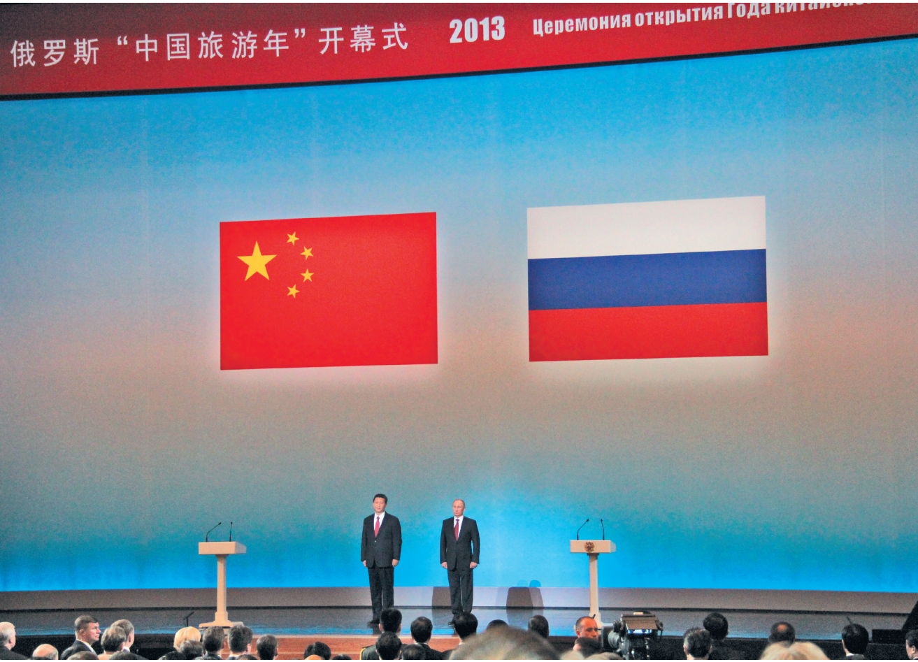
ВЛАДИМИР ПУТИН ОТМЕТИЛ, ЧТО ОТНОШЕНИЯ НАШИХ СТРАН ПЕРЕЖИВАЮТ ЛУЧШИЙ ПЕРИОД В ИСТОРИИ.

Так же успешно развиваются и двусторонние отношения — по мнению лидеров, они переживают наилучший период в истории. Китайский лидер констатировал, что за 20 лет удалось достичь стратегического партнерства и призвал усилить взаимную политическую поддержку, а также превратить преимущества политических