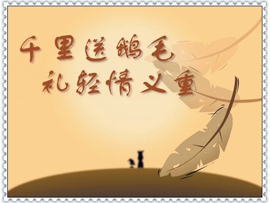
ПОДАРОК ЛЕГКО — ЧУВСТВА ВЕСОМЫ.

Вручая подарок, не забывайте сопровождать его добрыми пожеланиями, например, 恭喜发财 gōng xǐ fā cái (желаем процветания) и 万事如意 wàn shì rú yì (желаю исполнения всех желаний).