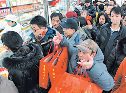
КИТАЙЦЫ ЛЮБЯТ ДАРИТЬ ПОДАРКИ. И ДЕЛАЮТ ЭТО ПО ВСЕМ ПРАВИЛАМ.

Коробки со сладостями и фруктами должны упаковываться в четном