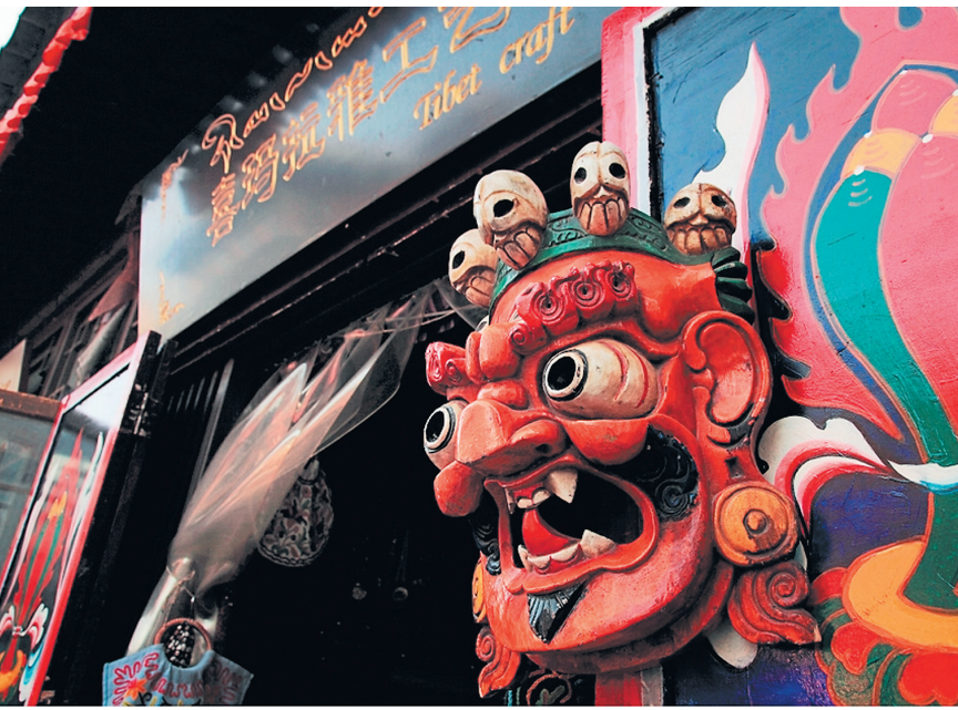
В РАЙОНЕ БАШЕН И ЯНЬДАЯ ВАС ВСЕ ЕЩЕ ЖДЕТ СТАРЫЙ ПЕКИН С ЕГО УНИКАЛЬНОЙ АТМОСФЕРОЙ.

Все-таки верна пословица «лучше один раз увидеть». В районе башен и Яньдая вас все еще ждет старый Пекин с его уникальной атмосферой. Почувствовать себя в древнем Даду, оценить самобытность происходящего, приобрести сувениры и сделать множество фото — все это возможно, даже не выезжая из китайской столицы.