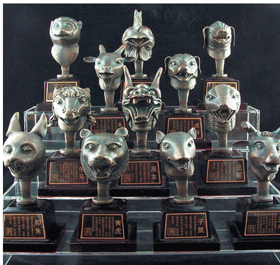
В 2000 ГОДУ НА АУКЦИОНЕ В СЯНГАНЕ НА ПРОДАЖУ БЫЛ ВЫСТАВЛЕН РЯД АРТЕФАКТОВ ИЗ ЮАНЬМИНЬЮАНЯ.