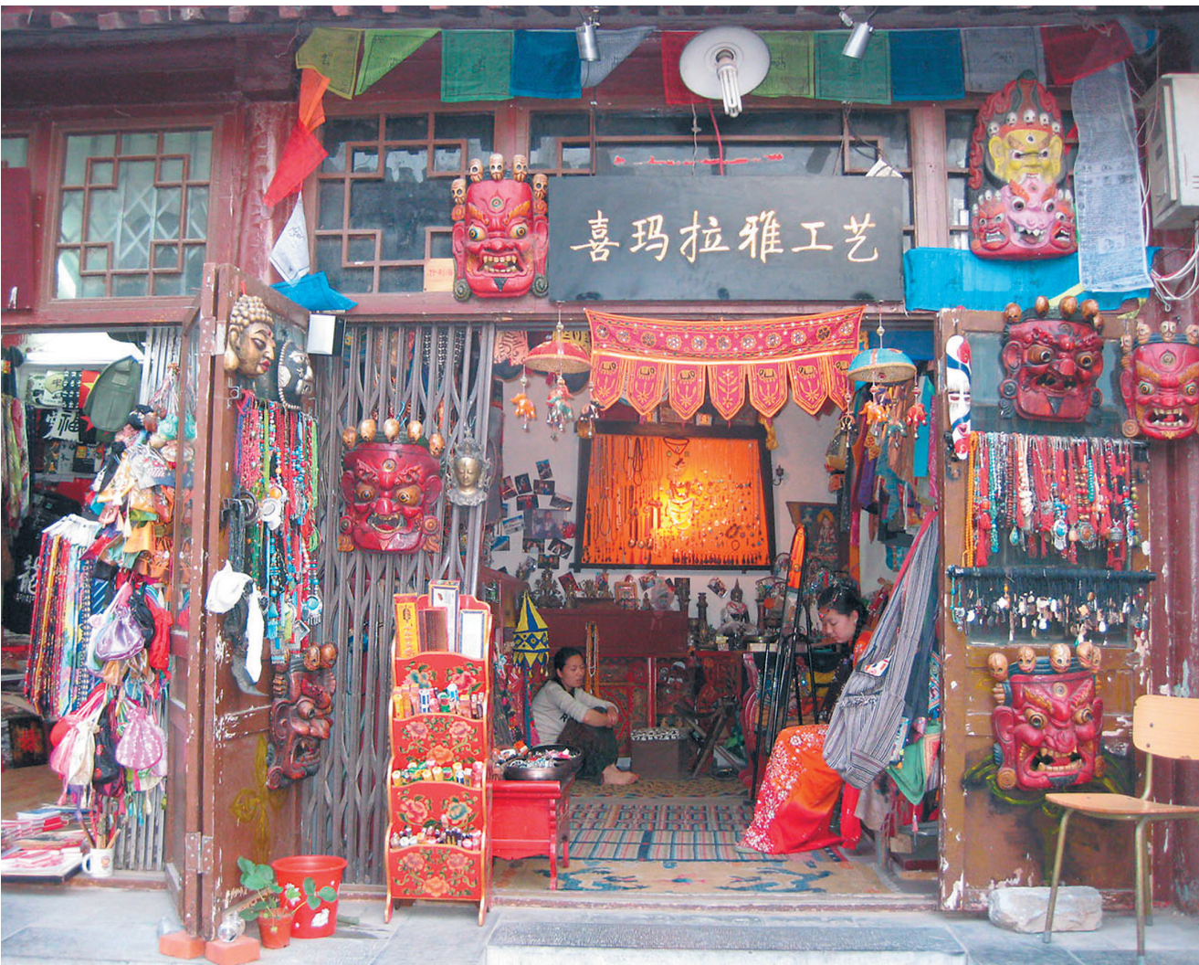
БОЛЬШАЯ ЧАСТЬ ОДНОЭТАЖНЫХ ЗДАНИЙ ЯНЬДАЙ ЗАНЯТО ЛАВКАМИ СУВЕНИРОВ, МАГАЗИНАМИ ЭКСТРАВАГАНТНОЙ АВТОРСКОЙ ОДЕЖДЫ И АНТИКВАРНЫХ ТОВАРОВ.

Отмечать течение времени человечество научилось давно. Китайская цивили-