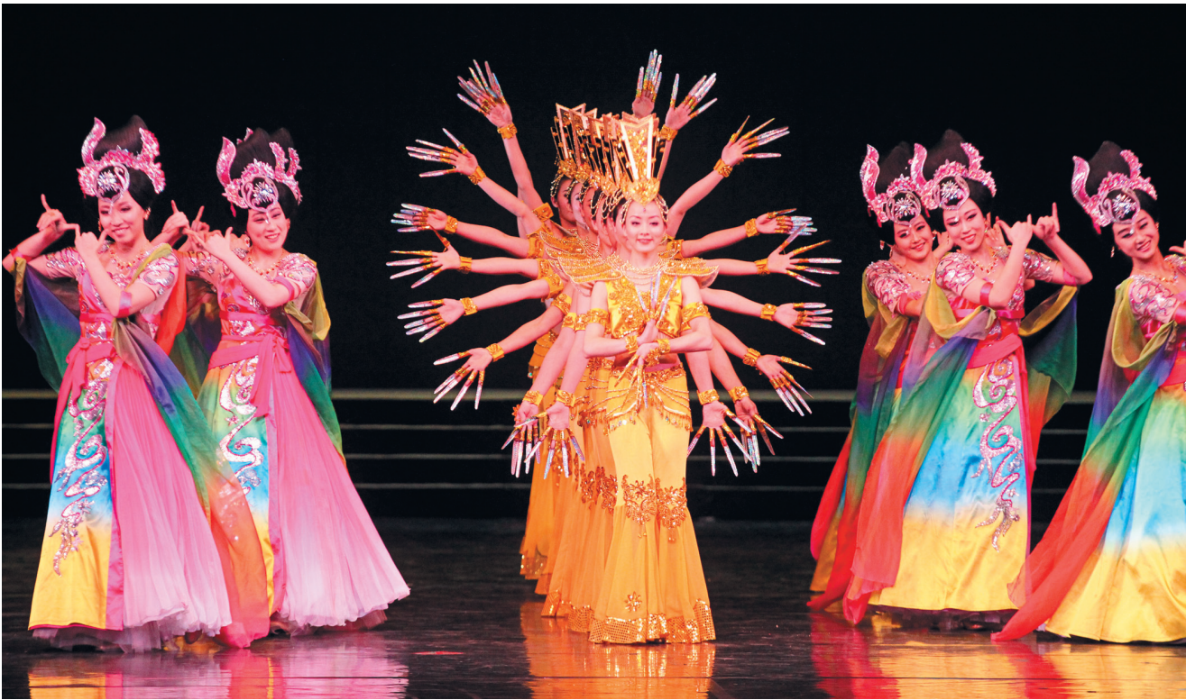
ТОРЖЕСТВЕННОЕ ОТКРЫТИЕ ГОДА КИТАЙСКОГО ТУРИЗМА В РОССИИ, КОТОРОЕ ПРОХОДИЛО НА СЦЕНЕ КРЕМЛЕВСКОГО ДВОРЦА, ЗАПОМНИТСЯ БУЙСТВОМ КРАСОК.

В рамках Года китайского туризма в России будет проведено порядка 200 мероприятий: презентации туристических возможностей и инвестиционных проектов, фестивали китайской культуры, форумы с участием