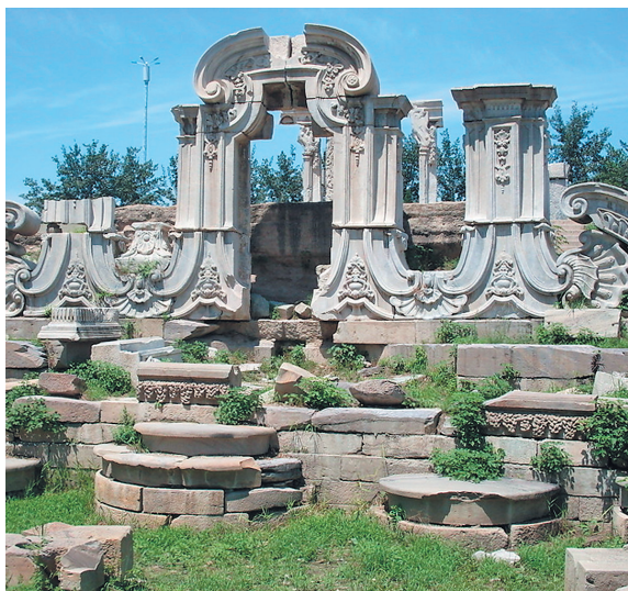
МРАМОРНЫЕ РУИНЫ ЮАНЬМИНЬЮАНЯ.

Руины дворца ждут возвращения 12 знаков зодиака