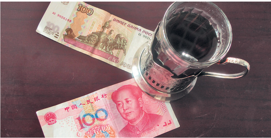
ЭКСПЕРТЫ СОВЕТУЮТ РОССИЯНАМ СЕЙЧАС ХРАНИТЬ СБЕРЕЖЕНИЯ В ЮАНЯХ ТОЛЬКО В СЛУЧАЕ, ЕСЛИ ЭТО ДОЛГОСРОЧНЫЙ ВКЛАД, КОТОРЫЙ НЕ ПРИДЕТСЯ ИСПОЛЬЗОВАТЬ В БЛИЖАЙШЕЕ ВРЕМЯ.

Волна интернационализации китайской валюты докатилась до России в декабре