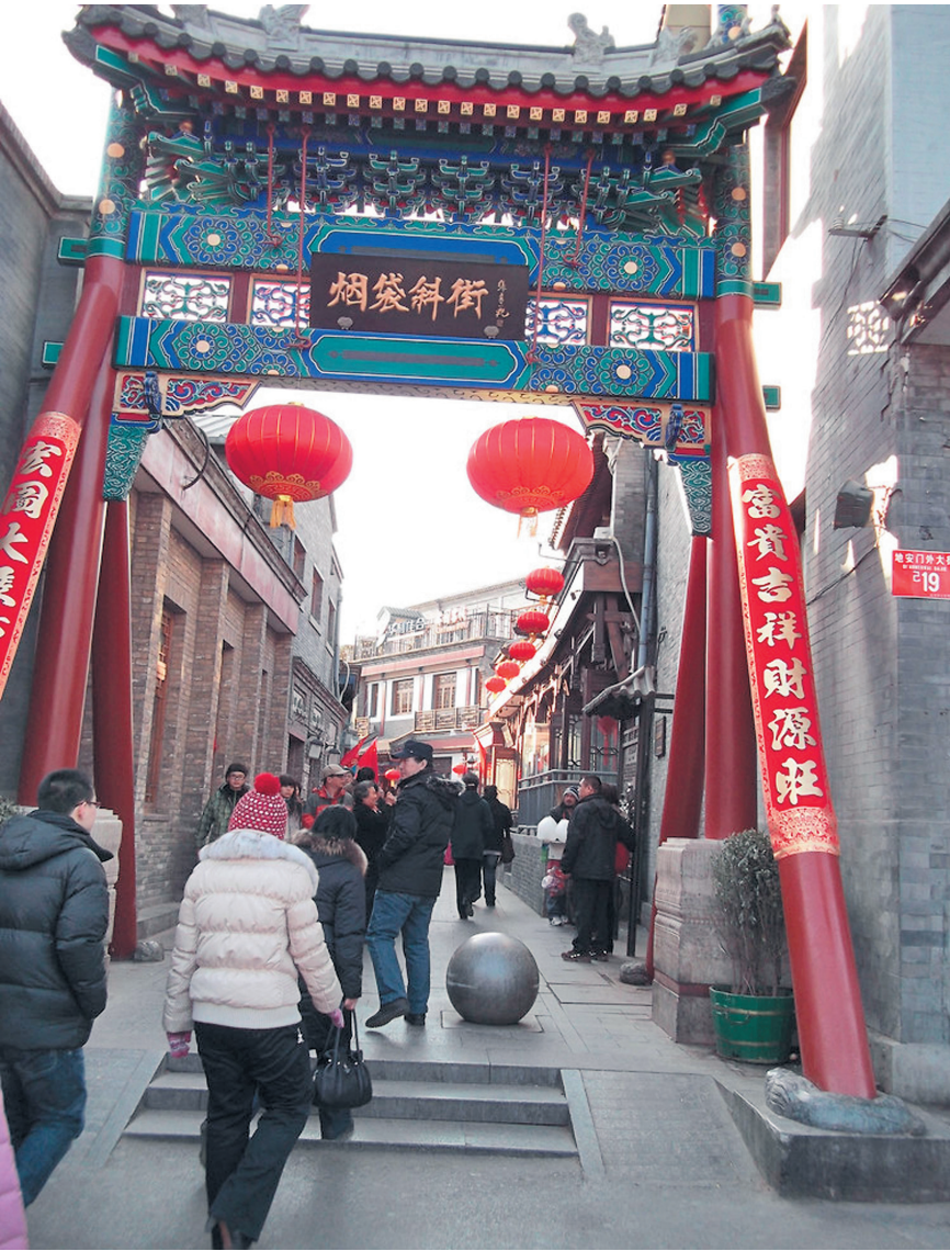
ХОУХАЙ ПРИВЛЕКАЕТ, ПОЖАЛУЙ, НАИБОЛЬШЕЕ ЧИСЛО ТУРИСТОВ, ПРИБЫВАЮЩИХ СЕГОДНЯ В ПЕКИН.

жающих ее государственных учреждений. Самым же оживленным местом, бесспорно, были и остаются до сих пор окрестности озера Хоухай. Название Хоухай носит не только само озеро, но и исторический район вокруг него. Именно Хоухай привлекает, пожалуй, наибольшее число туристов, прибывающих сегодня в Пекин. Дело в том, что район представляет интерес сразу для многих категорий путешественников — как для интересующихся историей и культурой,