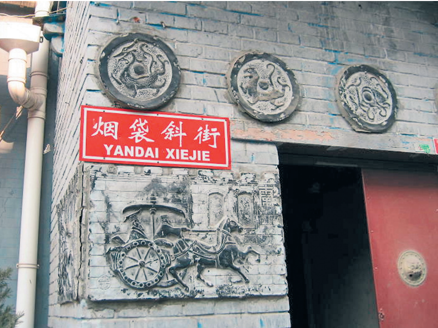
КИТАЙСКИЕ ИСТОРИЧЕСКИЕ ИСТОЧНИКИ УТВЕРЖДАЮТ, ЧТО ЯНЬДАЙ — СТАРЕЙШИЙ ХУТУН ПЕКИНА.