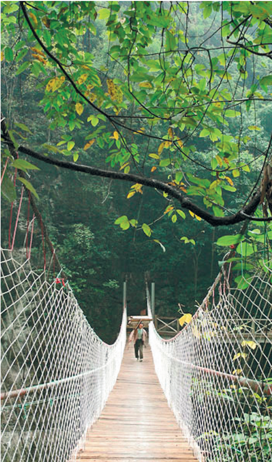
для моста нужны люди — те, кто его будет строить, и те, кто будет по нему ходить...

При чем здесь венецианец Марко Поло? Он был первым из иностранцев, посетивших Китай еще в XIII в. Он видел все свои