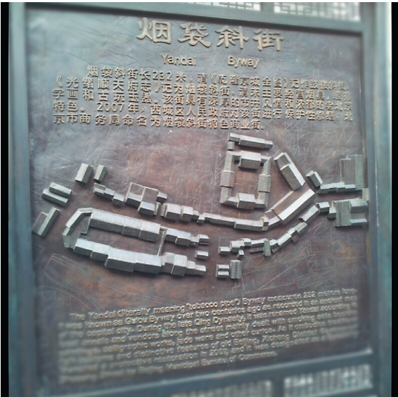
«ЯНЬДАЙ» В ПЕРЕВОДЕ — ЭТО КУРИТЕЛЬНАЯ ТРУБКА.