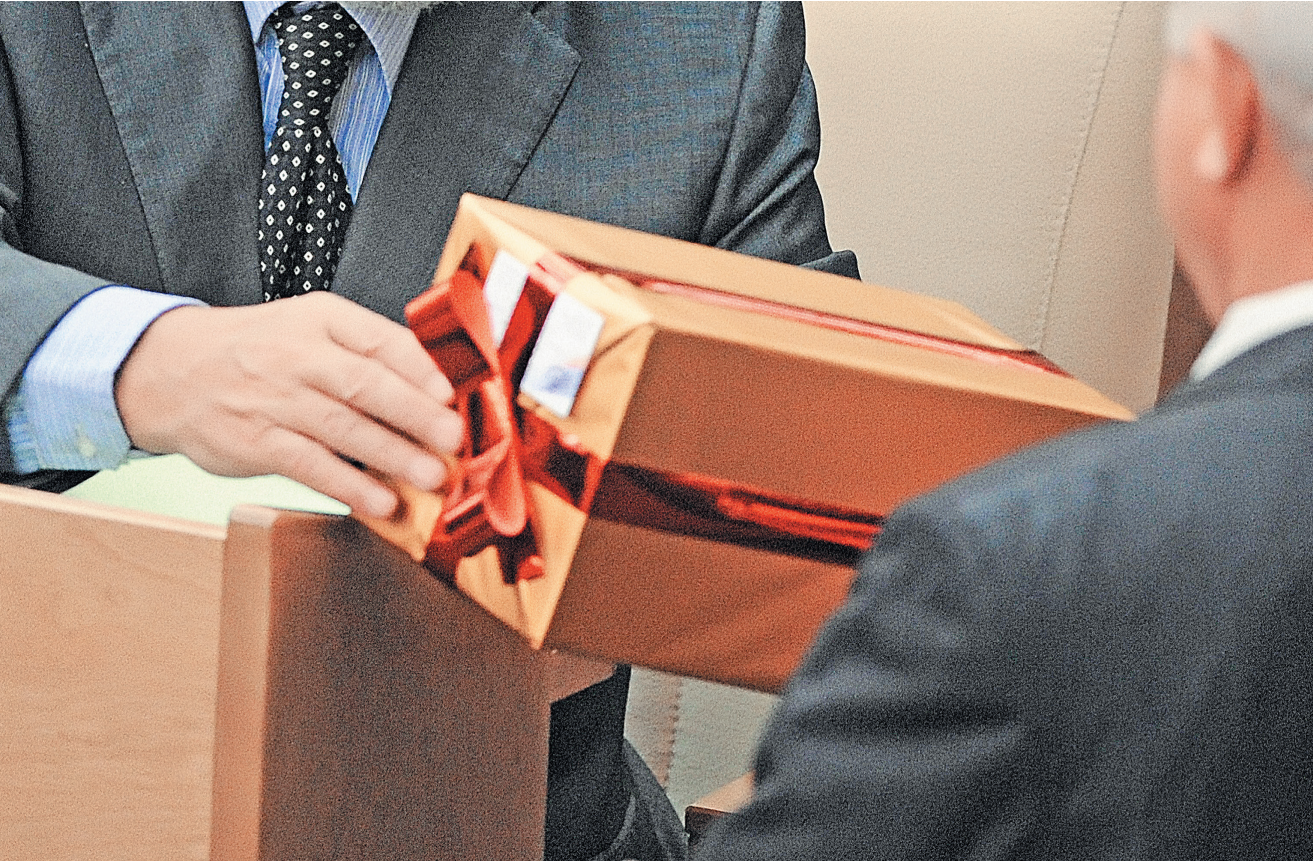
ЗА ПОДАРКАМИ ЧИНОВНИКАМ БУДЕТ УСТАНОВЛЕН ЖЕСТОЧАЙШИЙ КОНТРОЛЬ.

Таким образом, за счет борьбы с чиновничьими пороками новые руководители страны намерены найти довольно много денег на помощь тем, кто больше всего нуждается в государственной поддержке. Чем не «китайская мечта»?