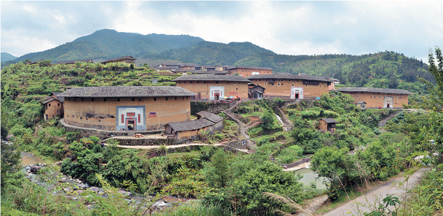
тулоу был не только надежной крепостью, но и самодостаточным хозяйством.

Классические тулоу высотой три-четыре этажа. Гладкая и неприступная с внешней стороны наружная стена замыкает помещения, соединенные внутренней галереей. Галереи, в свою очередь, разделены по вертикали на восемь секторов толстыми стенами, служившими для предотвращения распространения огня в случае пожара. В результате постройка напоминает огромный «ба-гуа» — восьмиугольный даосский символ. Во внутреннем дворе находился клановый алтарь. Крепость обязательно имела тайный выход, который был надежно замаскирован. Некоторые богатые тулоу имели во дворах собственные колодцы.