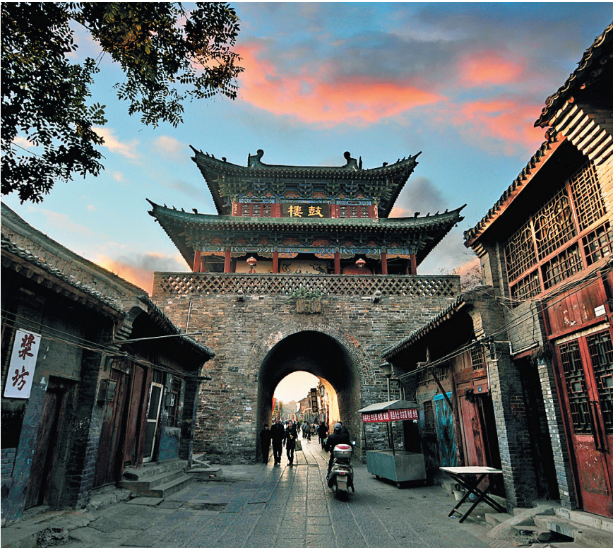
столицу 13 династий по праву считают «миниатюрой древней китайской истории».

Лоян не только город-музей, но и родина пионов