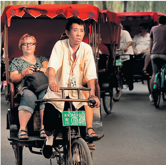
В НАШИ ДНИ ШУМНАЯ ЯНЬДАЙ ИЗОБИЛУЕТ ТУРИСТАМИ.