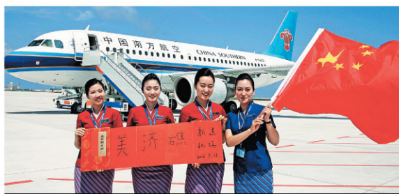
Китай успешно протестировал аэродромы в Южно-Китайском море. Члены экипажа компании «Китайские южные авиалинии» (China Southern Airlines) держат китайский национальный флаг, после того как самолет приземлился в аэропорту Нью-Китай на рифе Мисчиф (Мэйцзи).

Официальный Пекин довольно долго пытался, но в конце концов устал разводить дипломатию вокруг откровенной экспансии Вашингтона в регионе, особенно попыток влезть в решение проблем Южно-Китайского моря. Китайский представитель Дай Бинго, выступая в американской столице, прямо заявил: «Соединенным Штатам не запугать КНР даже если они введут в Южно-Китайское море все свои десять авианосцев, а американские соколы за попытки поиграть мускулами заплатят «неожиданно высокую цену». При этом политик попытался развенчать опасения американских коллег о том, что КНР хочет стать региональным гегемоном и вытеснить США за океан: «Не стоит пытаться предсказывать действия КНР в Южно-Китайском море, основываясь на западных представлениях о дипломатии. Утверждения о том, что в Пекине хотят превратить Южно-Китайское море в «азиатский Карибский бассейн» или установить там свою «доктрину Монро», о том, что Китай борется с США за господство в Азии или в мире, все это беспочвенные выдумки. Для нас вопрос Южно-Китайского моря — это вопрос суверенитета и безопасности, вопрос недопущения дальнейших трагических потерь нашей территории — вот и все. У нас нет ни намерений, ни возможностей втягиваться в стратегическое соперничество с кем бы то ни было. У нас нет амбиций править всей Азией или всем миром».