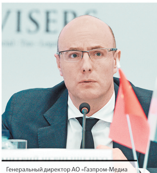
Генеральный директор АО «Газпром-Медиа Холдинг» Дмитрий Чернышенко на форуме отметил растущее сотрудничество с китайскими коллегами в медийной сфере.