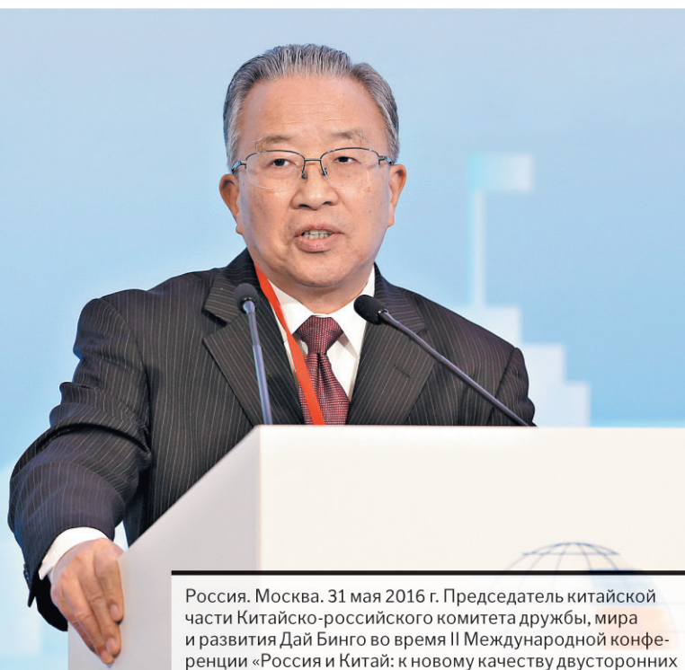
Россия. Москва. 31 мая 2016 г. Председатель китайской части Китайско-российского комитета дружбы, мира и развития Дай Бинго во время II Международной конференции «Россия и Китай: к новому качеству двусторонних отношений».