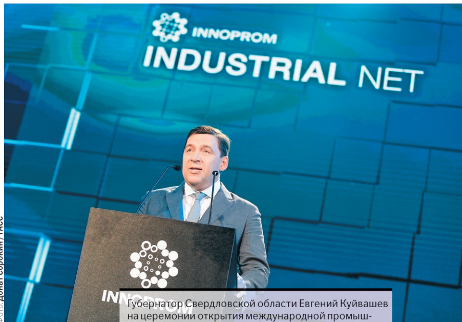
Губернатор Свердловской области Евгений Куйвашев на церемонии открытия международной промышленной выставки «Иннопром-2016» в выставочном центре «Екатеринбург-Экспо».

Среди конкурентных преимуществ нашего региона — географическое положение на стыке Европы и Азии, в центре России, где проходят