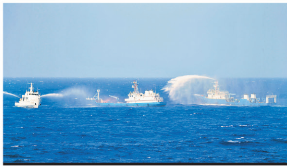
Китайские корабли во время поисково-спасательных учений в Южно-Китайском море 14 июля 2016 года.

основании Китай не участвует и не признает арбитраж.