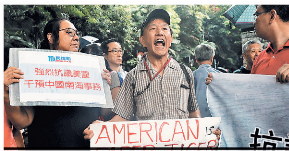
Недовольные решением международного суда по Южно-Китайскому морю протестуют у консульства США в Гонконге. Китай, 14 июля 2016 года.

История страстей по Южно-Китайскому морю насчитывает не годы, а века. Местные островные территории в разные периоды контролировали испанцы, французы и японцы. Немецкий флот вел здесь активную «исследовательскую деятельность», цели которой выходили далеко за рамки географических изысканий. Пристальное внимание к малоприспособленным для нормальной жизни островкам и рифам было вызвано геополитическими и экономическими факторами. Южно-Китайское море уже давно является важным судоводным маршрутом. Сегодня через его акваторию перемещается половина объема глобальной морской торговли. Именно через него осуществляется поставка 80% нефти в Японию, Республику Корея и на Тайвань. В связи с этим китайские СМИ, не стесняясь, отмечают: «С военной точки зрения тот, кто контролирует острова Южно-Китайского моря, фактически контролирует Малаккский пролив и все пути из Европы,