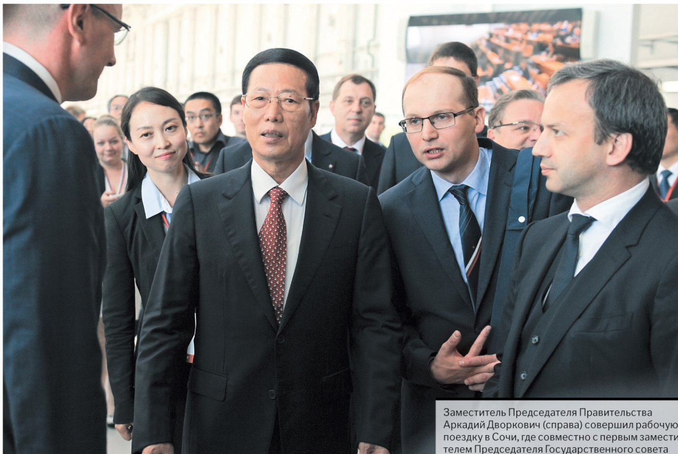
Заместитель Председателя Правительства Аркадий Дворкович (справа) совершил рабочую поездку в Сочи, где совместно с первым заместителем Председателя Государственного совета КНР Чжаном Гаоли (в центре) провел заседание межправительственной Российско-Китайской комиссии по энергетическому сотрудничеству. Аркадий Дворкович и Чжан Гаоли также приняли участие в церемонии открытия второго Российско-Китайского делового форума малого и среднего бизнеса.