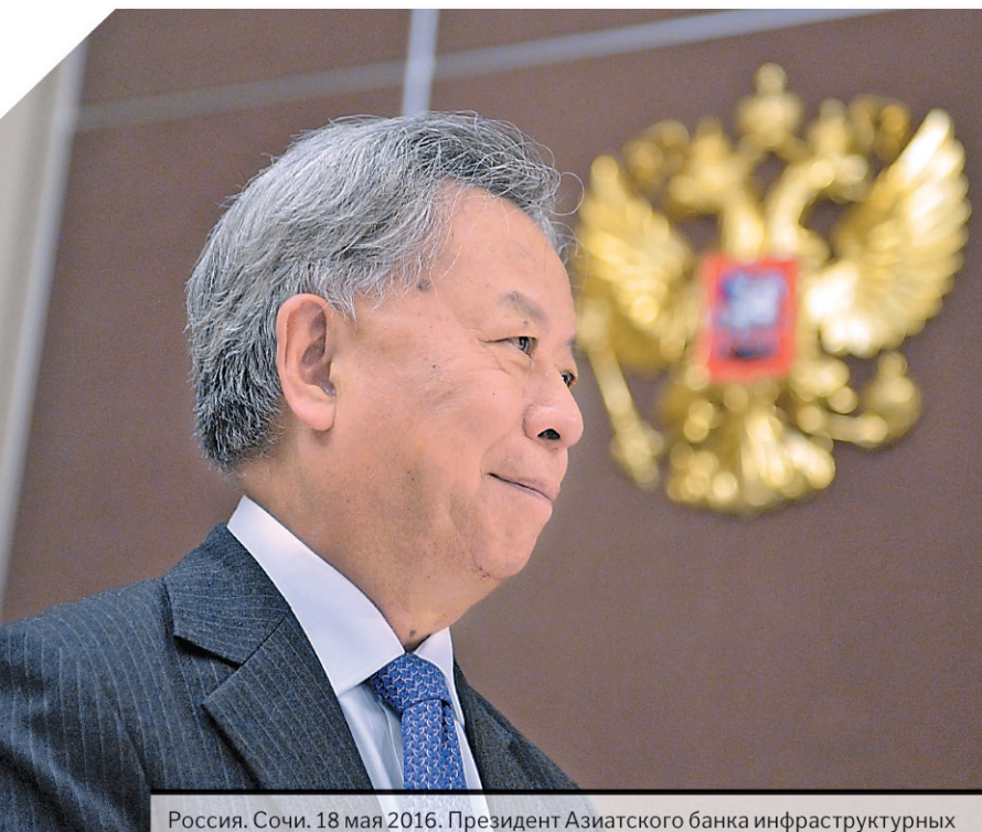
Россия. Сочи. 18 мая 2016. Президент Азиатского банка инфраструктурных инвестиций (АБИИ) Цзинь Лицунь во время встречи с президентом России.

БАНК БРИКС И АБИИ ГОТОВЯТ СЕРЬЕЗНЫЕ ЗАЯВКИ НА ИНВЕСТИРОВАНИЕ ИНФРАСТРУКТУРНЫХ ПРОЕКТОВ