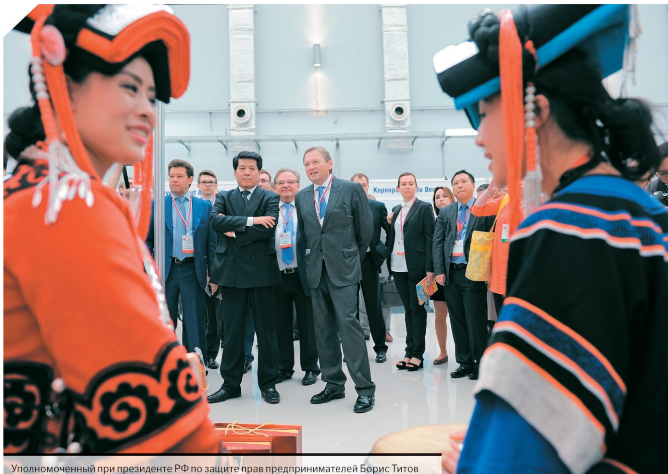
Уполномоченный при президенте РФ по защите прав предпринимателей Борис Титов и посол КНР в РФ Ли Хуэй (справа налево) во время открытия выставки продукции Китая на Российско-Китайском деловом форуме малого и среднего бизнеса-2016.